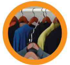
1. CLOSETS ARMARIOS

Infestation Instructions on reverse side.