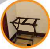
2. LUGGAGE STAND EQUIPAJE DE SOPORTE