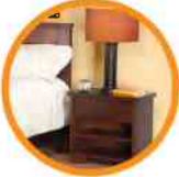
4. NIGHTSTAND/DRESSER MESAS DE NOCHE/APARADOR