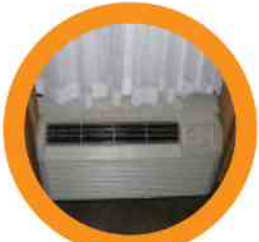
6. HEAT/AC VENT CALOR/AC VENT