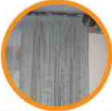
7. DRAPES/CURTAINS/BLINDS TAPICES/CORTINAS/PERSIANAS