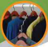
1. CLOSETS ARMARIOS

For additional information or to re-order product please call: 1.800.747.1885 or online at www.restasure.net