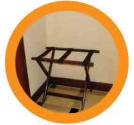
2. LUGGAGE STAND EQUIPAJE DE SOPORTE