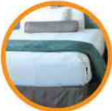
8. MATTRESS/COMFORTER COLCHÓN/CONSOLADOR