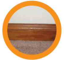
3. BASEBOARDS ZÓCALO