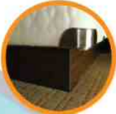
9. BOX SPRING LA BASE DEL COLCHÓN