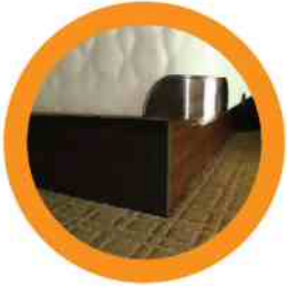
9. BOX SPRING LA BASE DEL COLCHÓN