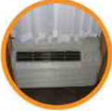
6. HEAT/AC VENT CALOR/AC VENT