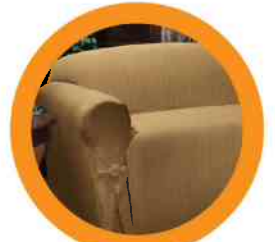
5. CHAIRS/COUCHES SILLAS/COUCHES