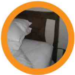
10. HEADBOARDS CABECEROS