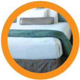
8. MATTRESS/COMFORTER COLCHÓN/CONSOLADOR