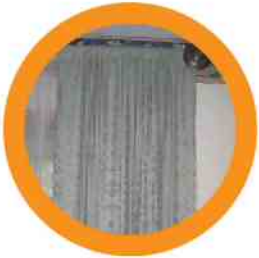
7. DRAPES/CURTAINS/BLINDS TAPICES/CORTINAS/PERSIANAS