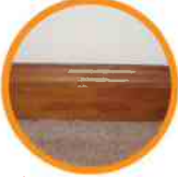
3. BASEBOARDS ZÓCALOS