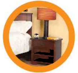
4. NIGHTSTAND/DRESSER MESAS DE NOCHE/APARADOR