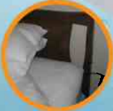
10. HEADBOARDS CABECEROS